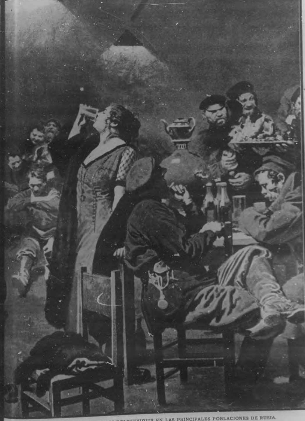
POR EL ANTERIOR GRABADO PODRAN DARSE UNA IDEA NUESTROS LECTORES DE LA VIDA DE DISIPACI