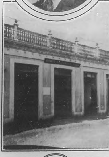
Banco Nacional de Cuba