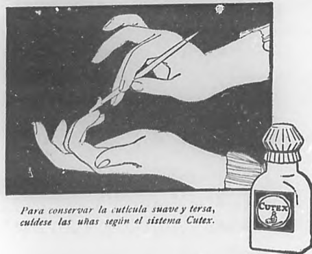
Para conservar la cutícula suave y tersa, cútelas las uñas según el sistema Cutex.