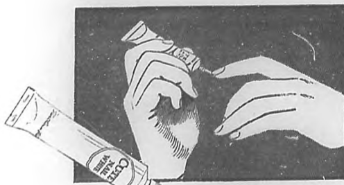
Para dar a las extremidades de las uñas una blancura impecable, aplíquese una pequeña cantidad de Blanco Cutex.