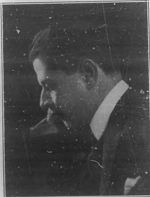
JOSE RAUL CAPABLANCA

—Admirablemente bien, quedé encantado de esa visita a la hermosa tierra de nuestros antepasados. Celebré sesiones simultáneas y matches en Bilbao, Madrid, Sevilla y Barcelona, concurrendo lo más notable y dis-