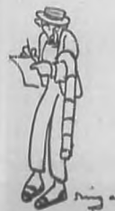
Cronista de Policía

Aquí tenéis al Jefe de Redacción: Que joven, dice la señorita Belleza y qué guapo exclama Doña Abstinencia; Le creáis un anciano: un hombre malhumorado constantemente, debido a la diversidad de trabajo moral y material, que, por su puesto mismo debe de tener? No tal, ya lo veís. Clasifica, estudia, dispone el innumero material que debe ser preparado para el diario de mañana: en breves horas tiene que estar todo hecho, desde engendrar el Editorial hasta el parto del número a los vocadores. Por las manos de este señor pasar los originales todos que van a los linotipos o al castro de papeles inútiles. Este joven de años y viejo ya en el conocimiento humano por la variedad de sus impresiones, se retira al café vecino a las tres de la madrugada en donde traga a primera, cansado y nervioso, como plomo derretido, el último líquido que lo separa entre la imprenta y su casa. Durante las dos primeras horas de su sueño, aún da órdenes: