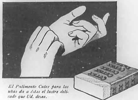
El Pulimento Cutex para las uñas da a éstas el lustre telcado que Ud. desea.