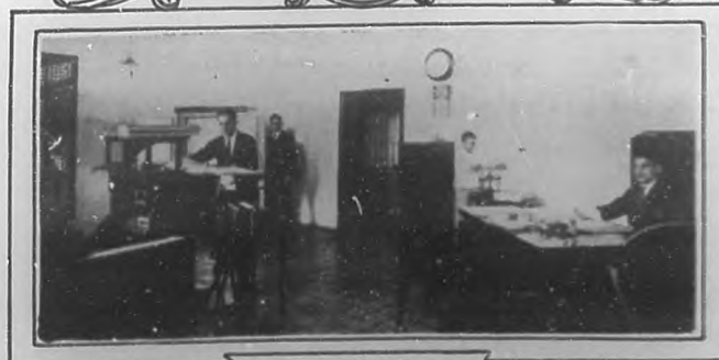
Oficinas del Banco

Sucursal del Banco Nacional de Cuba en Quemado de Guines.