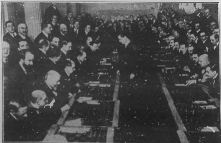
José Raúl Capablanca, el campeón cubano de ajedrez, jugando treinta partidas simultáneas en el Casino de Madrid.

Atendiendo al cúmulo de razones que de manera discreta y confidencial me expusiera Capablanca, vine a determinar que los cubanos ro sabemos agradecer las gallardías de ese joven con patriota cuyo genio es un bellísimo girón de luz, de luz única, que ilumina esa rama del saber humano que se llama ciencia del ajedrez, y que nos sirve a modo de faro para encauzar la admiración y las simpatías de los demás pueblos.