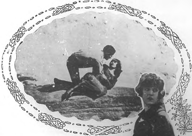
Mabel Normand en El último Capítulo

Todo el mundo quedó esperso ante la pregunta y Mabel, sacando de su bolsa una moneda de diez centavos, contestó el acto: "oye, dulce muchachito, yo tengo tan pocos años, cuantas escenas en "La Venus moeulo" recibidas por 20 y multi-