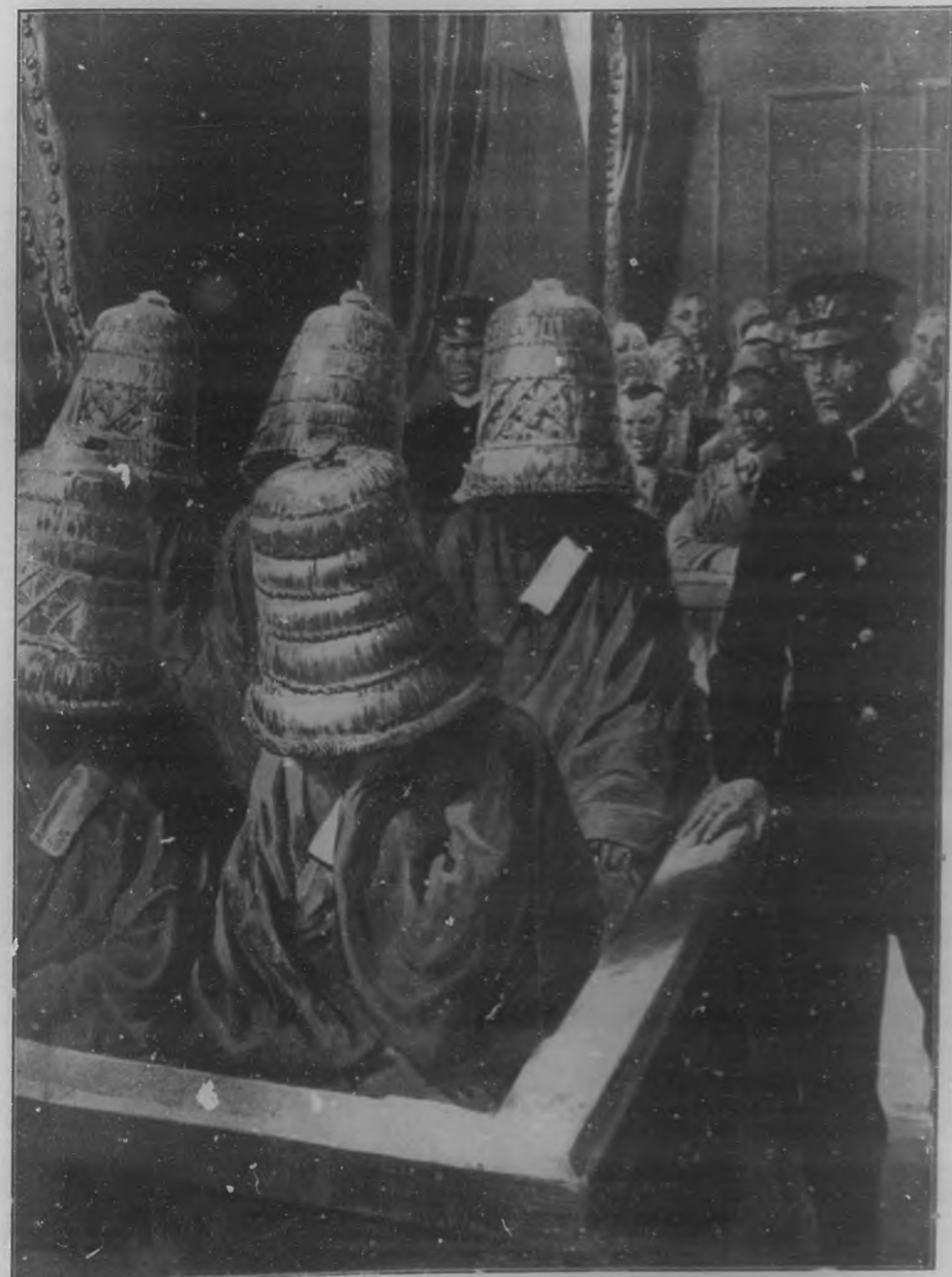
MEDIDA PRESERVATIVA CONTRA LAS MIRADAS DE LOS CURIOSOS.

Una extraña escena en el interior de una corte criminal del distrito de Tokio, en el Japón. Los cinco acusados, antes de salir a la calle, después de terminado el juicio, meten la cabeza en una especie de cesto de paja, para eludir las miradas de los curiosos.