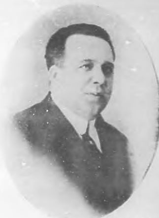
NESTOR DE LA TORRE Notable barítono canario.

Ambos artistas vienen revestidos de cier-