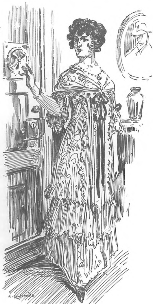
Sus pasos resonaron en las baldosas del zaguán...