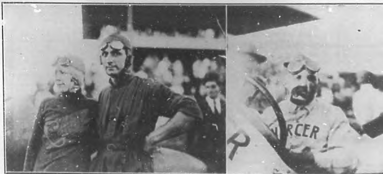
LAS CARRERAS DE AUTOMOVILES.— Los vencedores en las sensacionales carreras de los días 3 y 4 del mes actual.

La vida de la extinta es una brillante página de virtud, de patriotismo y de nobleza. Nació en Yara en el año 1850. Cuando estalló la revolución del 68, salió al